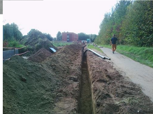
Een sleuf van 150 meter tot aan de straat, om alle nutsleidingen aan te sluiten.