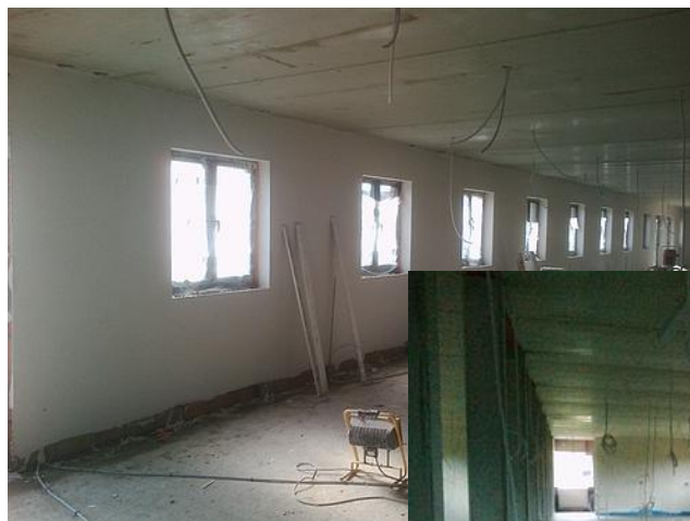
Bezetting en de eerste chapewerken