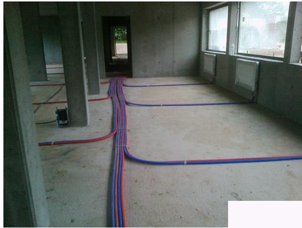
De technieken kunnen opstarten.